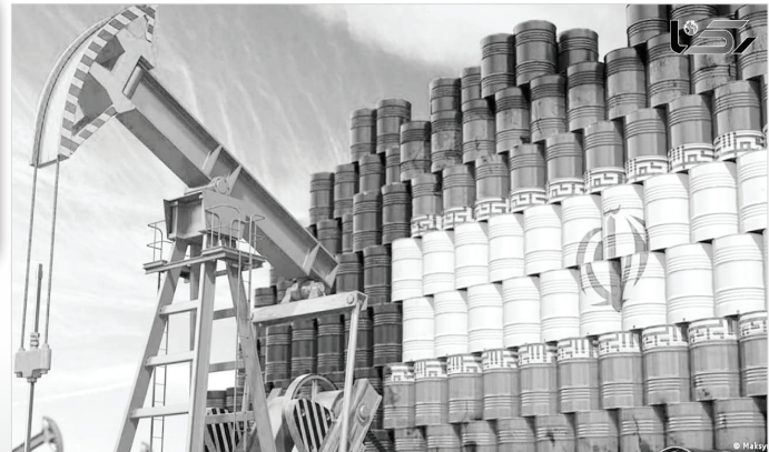
ایسنا- داده‌های شرکت ورتکسا نشان داد صادرات نفت ایران در سه ماهه نخست سال ۲۰۲۴ به بالاترین سطح در ۶ سال گذشته صعود کرده است.